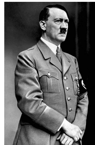
Adolf Hitler, 1937

Durant les années 1920-1930, l'Allemagne est touchée par la misère, l'inflation, l'agitation politique et économique. Les militants du NSDAP 1 profitent de ces circonstances pour tenter un coup de force à Munich en novembre 1923. C'est un échec, Hitler et les autres responsables sont condamnés à 5ans de prison. Cependant, Hitler est libéré dès 1924. Il a profité de son emprisonnement pour écrire « Mein Kampf » (son combat). Cela relate une idéologie raciste, antidémocrate et anticommuniste.