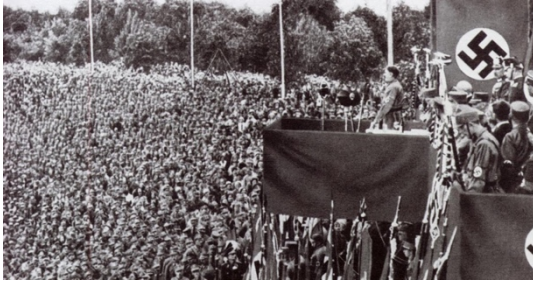
Discours d'A. Hitler aux allemands, 1933

chancelier, c'est-à-dire le ministre de la justice (celui qui gouverne), le 30 janvier 1933. Des milliers de nazis célèbrent cette prise du pouvoir dans les rues de Berlin.