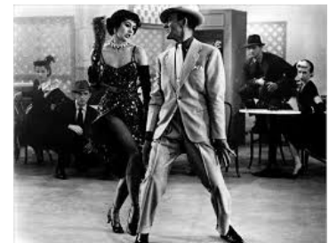
Le Jazz et la mode des années 1920

En Amérique, il y a une forte avancée dans l'industrie automobile (les voitures sont encore un luxe dans d'autres pays), les téléphones et l'électroménager. Un grand besoin de spectacles et de loisirs surgit. De nombreuses nouveautés apparaissent telles que le jazz, le cinéma et les comédies musicales. Le jazz prend naissance notamment à la Nouvelle-Orléans et dans les grandes métropoles. Il est entendu en boîte de nuit, dans les stations radio et dans les studios d'enregistrement. Quant au cinéma, connu durant ces années par différents acteurs mais en particulier Charlie Chaplin, il prend de l'ampleur de par le