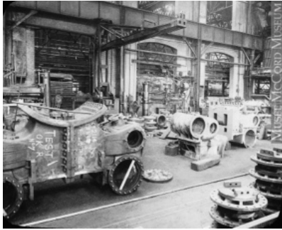
Intérieur des usines Angus, Montréal, 1930

Les américains sont persuadés de vivre un moment unique et ils sont fiers de triompher contre la pauvreté. La majorité a accès aux biens matériels, au travail et à la consommation. Ce sont des années de prospérité sans limites. La consommation pousse la production toujours vers le haut.