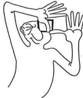
Dessin de Piem, Les mots du cinéma . C. de Montvalon, édition Belin, 1987