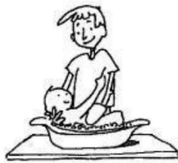
Il lave son frère. (verbe : laver )