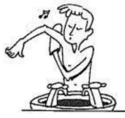
Il se lave. (verbe pronominal : se laver )

Un verbe pronominal a un effet "miroir" sur le sujet ou les sujets.